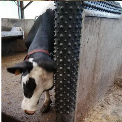
Tapis à picots