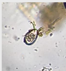
Œuf de coccidiose au microscope

Pour résumer : si vos veaux ne profitent pas bien et/ou ont de la diarrhée et/ou ont le poil piqué, ayez le réflexe copro !